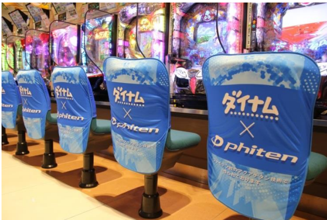
ファイテン社の技術が詰まった椅子カバー・専用手置きスタンドを開発。ファイテンの水溶化メタル技術「アクアチタン」を施しました。