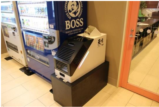
空気清浄機【天晴（あっぱれ）】MKP II-15 ミドリ安全エア・クオリティ株式会社