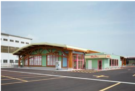
ダイナム信頼の森 福井越前店

健康への取り組みと街・人との繋がりを目的に、喫煙専用室の粉じん対策、健康サポート企業「ファイテン」とコラボした設備・空間・景品の用意、お客様とコミュニケーションを深めるカフェの新設など、パチンコだけではなく付加価値サービスを提供いたします。