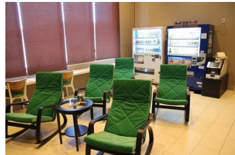
粉じん対策を施した喫煙専用室