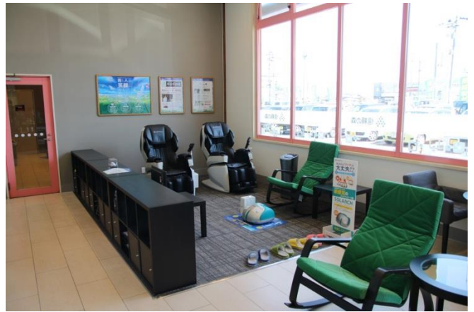
ファイテン社とコラボレーションし、マッサージチェアをはじめ、ラウンジ内の壁・天井・床面の一部にファイテン加工を施しております。