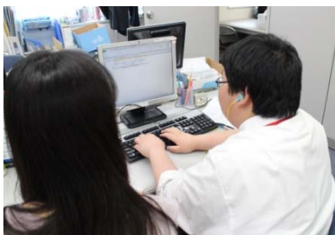
当社従業員と確認しながら、 会議録音を聞き取り議事録へ入力する様子