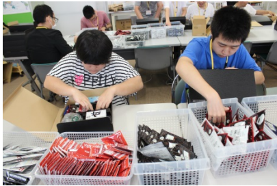
商品の箱詰め作業