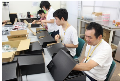
化粧箱の仕切り作り