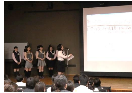
ワークショップ成果の発表