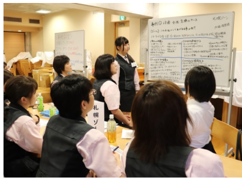
事例研究・グループワーク