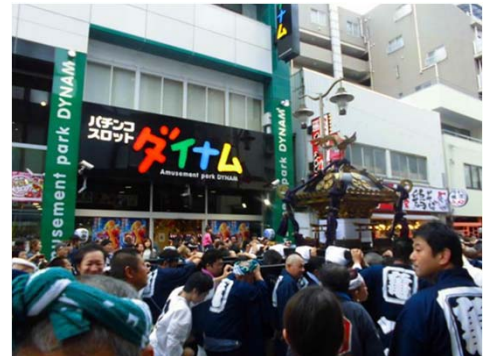
ダイナム亀有店 「亀有香取神社例大祭への協賛」