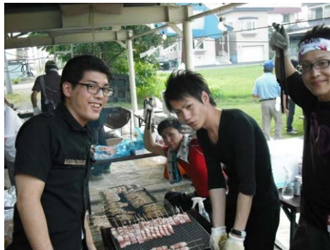
ダイナム帯広店 「東陽夏祭りへの協賛」